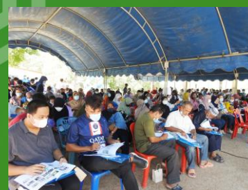
ผู้เข้าร่วมประชุมรับฟังรายละเอียดโครงการ