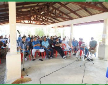
ผู้เข้าร่วมประชุมรับฟังรายละเอียดโครงการ