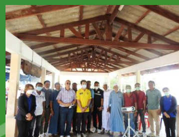
ผู้เข้าร่วมประชุมถ่ายภาพที่ระลึก