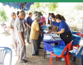
ผู้เข้าร่วมประชุมลงทะเบียน